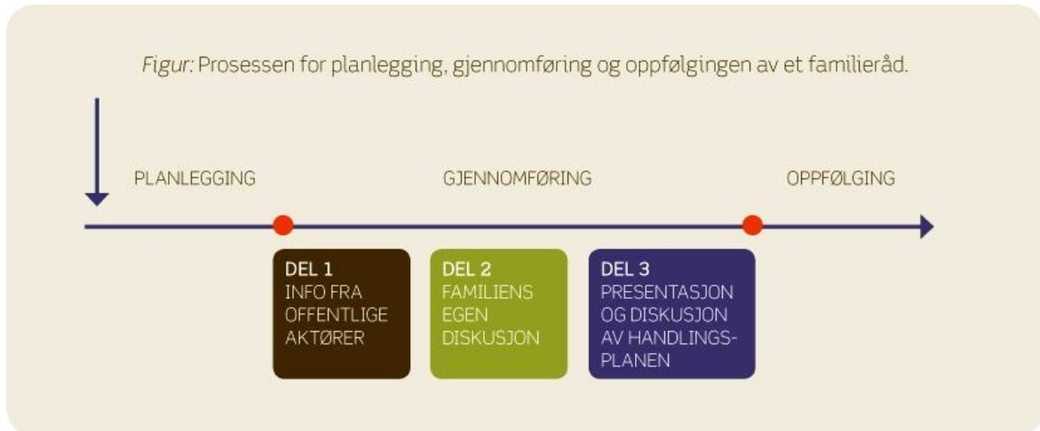
Figur 1 – Prosessen for planlegging, gjennomføring og oppfølgingen av et familieråd. (Strandbu 2008:16, gjengitt med tillatelse fra Svanhild Vik, Bufdir).

Gjennomføringen av familierådet er delt i tre hoveddeler: