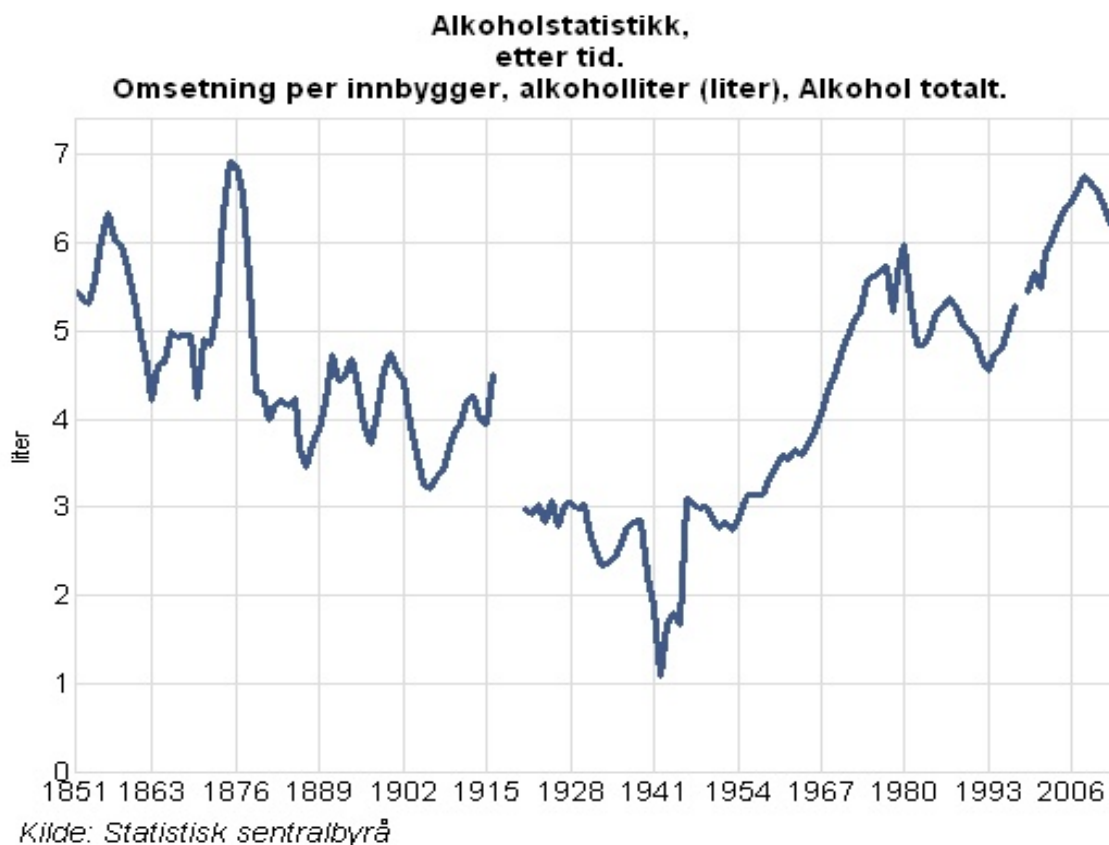
Figur 2. Alkoholomsetningen i Norge 1851-2013. Registrert forbruk. Kilde: SSBs statistikkbank.

Vær oppmerksom på hva som er beregningsgrunnlaget i tabellene. Vi beregner alkoholforbruket per innbygger 15 år og eldre. Ved internasjonale sammenlikninger benyttes av og til forbrukstall per innbygger, det vil si fra 0 år. Beregningene bak diagrammet som er publisert i kapitlet om alkohol og andre rusmidler i Folkehelse rapporten 2014, gjelder for befolkningen 15 år og eldre og er hentet fra Verdens helseorganisasjon (WHO)