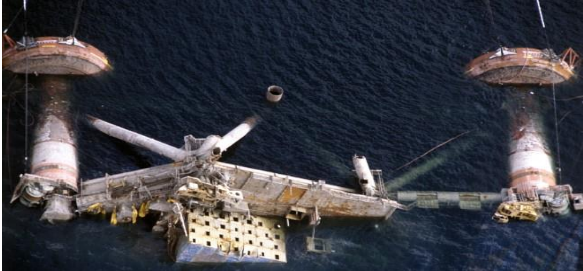
Bilde 1 - Alexander Kielland-plattformen etter kantringen.

20. april 2010 var det en ulykke på plattformen Deepwater Horizon i Mexicogolfen, hvor 11 mennesker mistet livet og rundt 15-20 personer ble skadet (Store Norske Leksikon, Macondo-ulykken). Det oppstod en gasseksplosjon da gass fra en av brønnene strømmet ukontrollert ut på dekk som ble etterfulgt av en voldsom brann. Etter to døgn sank innretningen og dette medførte et enormt olje- og gassutslipp i havområdene rundt ulykkesområdet, hvor omtrent 650.000 tonn råolje strømmet ut i havet. Det ble utført flere granskinger etter ulykken og rapportene tyder på at manglende vedlikehold førte til svikt av blant annet brann- og gass-sikkerhetssystemet.