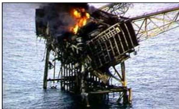
Bilde 3 – Piper Alpha anlegget etter ulykken.

Ulykken som regnes som den verste og mest alvorlige i forbindelse med oljeproduksjon, er ulykken som skjedde ved plattformen Piper Alpha (Store Norske leksikon, Piper Alpha) den 6. juli 1988. Plattformen befant seg på Piperfeltet i den britiske sektoren av Nordsjøen. Det oppstod en gasslekkasje som ble antent og deretter skapte en gasseksplosjon som førte til at oljeholdig utstyr brøt sammen. Etter rundt 60 minutter skjedde det en utstrømning av flere tonn med gass per sekund som følge av at det ikke var tilgjengelig vann til kjøling og slukking, og denne gassen tok umiddelbart fyr. Det ble en stor eksplosjon og den påfølgende brannen gjorde slik at store deler av plattformen smeltet eller tippet i sjøen. Flesteparten av arbeiderne på plattformen hadde låst seg inne i boligdelen av plattformen, da denne var beskyttet av en brannvegg, og denne delen befant seg nå i sjøen. Det omkom 167 mennesker denne sommerdagen.