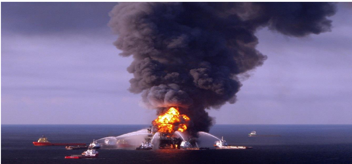
Bilde 2 - Slokking etter Deepwater Horizon-ulykken.

20. april 2010 var det en ulykke på plattformen Deepwater Horizon i Mexicogolfen, hvor 11 mennesker mistet livet og rundt 15-20 personer ble skadet (Store Norske Leksikon, Macondo-ulykken). Det oppstod en gasseksplosjon da gass fra en av brønnene strømmet ukontrollert ut på dekk som ble etterfulgt av en voldsom brann. Etter to døgn sank innretningen og dette medførte et enormt olje- og gassutslipp i havområdene rundt ulykkesområdet, hvor omtrent 650.000 tonn råolje strømmet ut i havet. Det ble utført flere granskinger etter ulykken og rapportene tyder på at manglende vedlikehold førte til svikt av blant annet brann- og gass-sikkerhetssystemet.