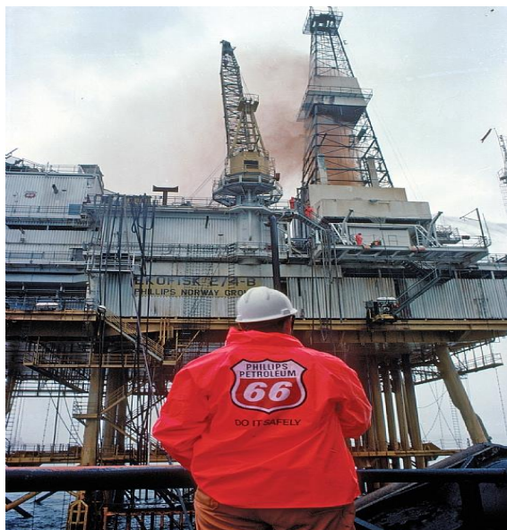
Bilde 4 - Utblåsningen på plattformen Ekofisk B.